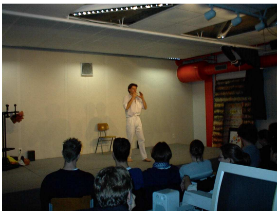
...üben für den richtigen Auftritt auf der Bühne

nicht die Near Nativeness an. Vielmehr wollen wir mit den native Speakers und oft auch mit anderen Foreign Speakers im Medium der fremden Sprachen erfolgreich kommunizieren“.