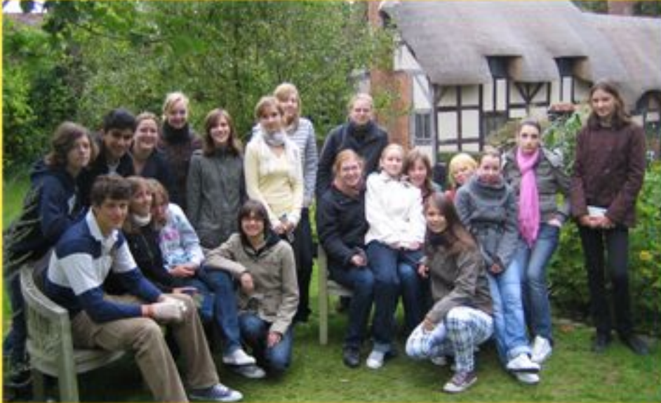
in der Shakespeare - Stadt Stratford

3. Tag, Mittwoch Shakespeare - Tag 10.00 Uhr Ankunft in Stratford, ca. 1 Stunde Busfahrt von Oxford, Besuch und jeweils eine Führung in Ann Hathaway's Cottage, Mary Arden' Farm und Shakespeare's birthplace Nachmittag: Stadterkundung in kleinen Gruppen