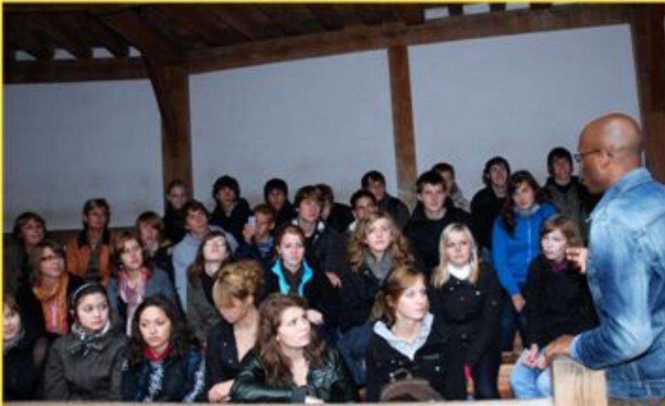
im Globe Theatre an der Themse

4.Tag, Mittwoch Tagesfahrt nach London - nach Ankunft am Themseufer von Westminster erster kurzer Rundgang - leider im Regen - zu einigen touristischen Highlights, dann zu Fuß Richtung Globe Theatre mit Pausen auf dem Jubilee Walk . Nachmittag: Führung und Workshop im Globe Theatre aber dann: Stadterkundung mit Shopping in kleinen Gruppen ca. 18.00 Uhr Rückfahrt nach Oxford