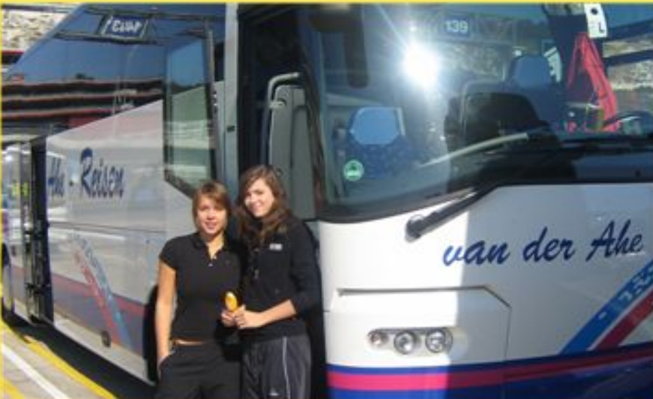
Warten auf die Fähre