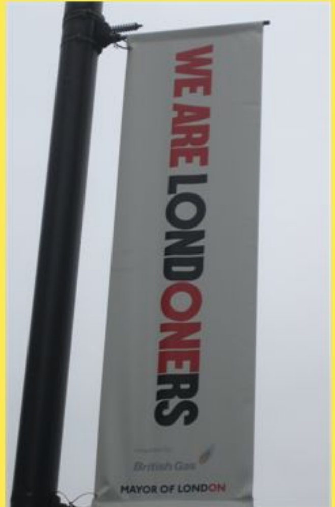
Londoner gegen Fremdenfeindlichkeit