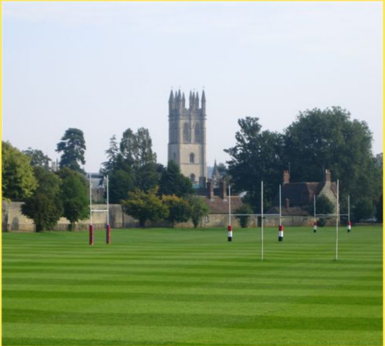
Rugby-Platz für die Studenten in Oxford