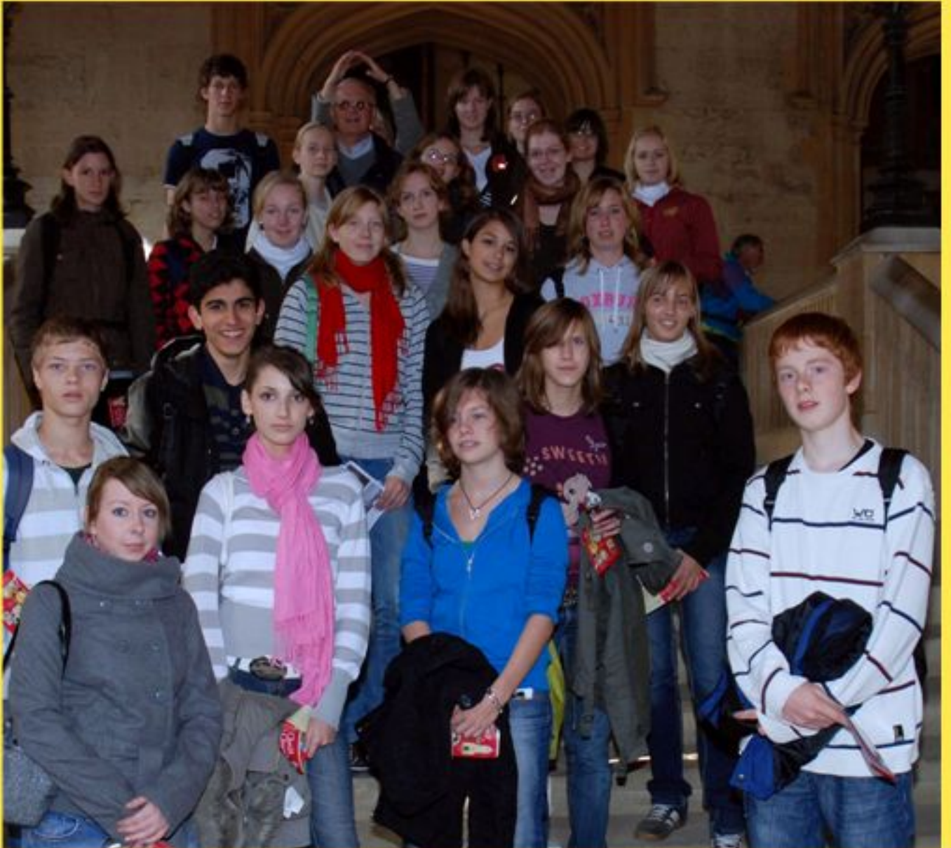
im Christ Church College - hier wurde Harry Potter verfilmt