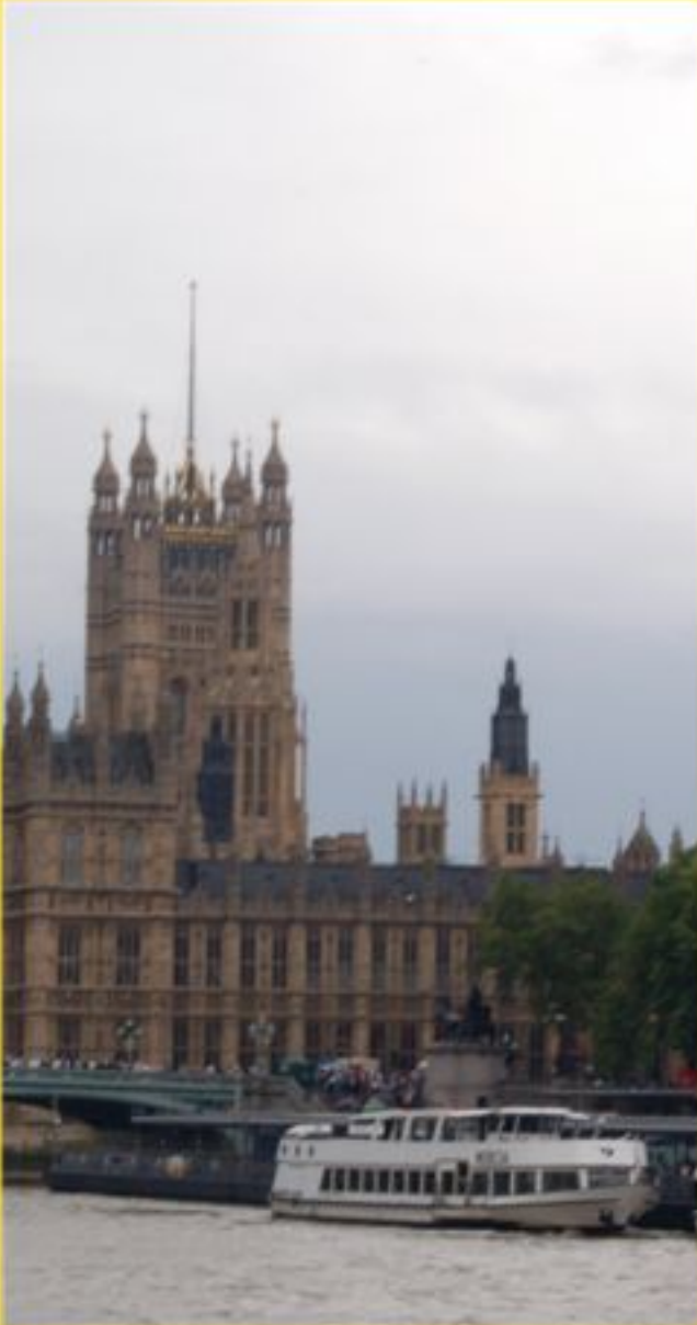
vor den Houses of Parliament