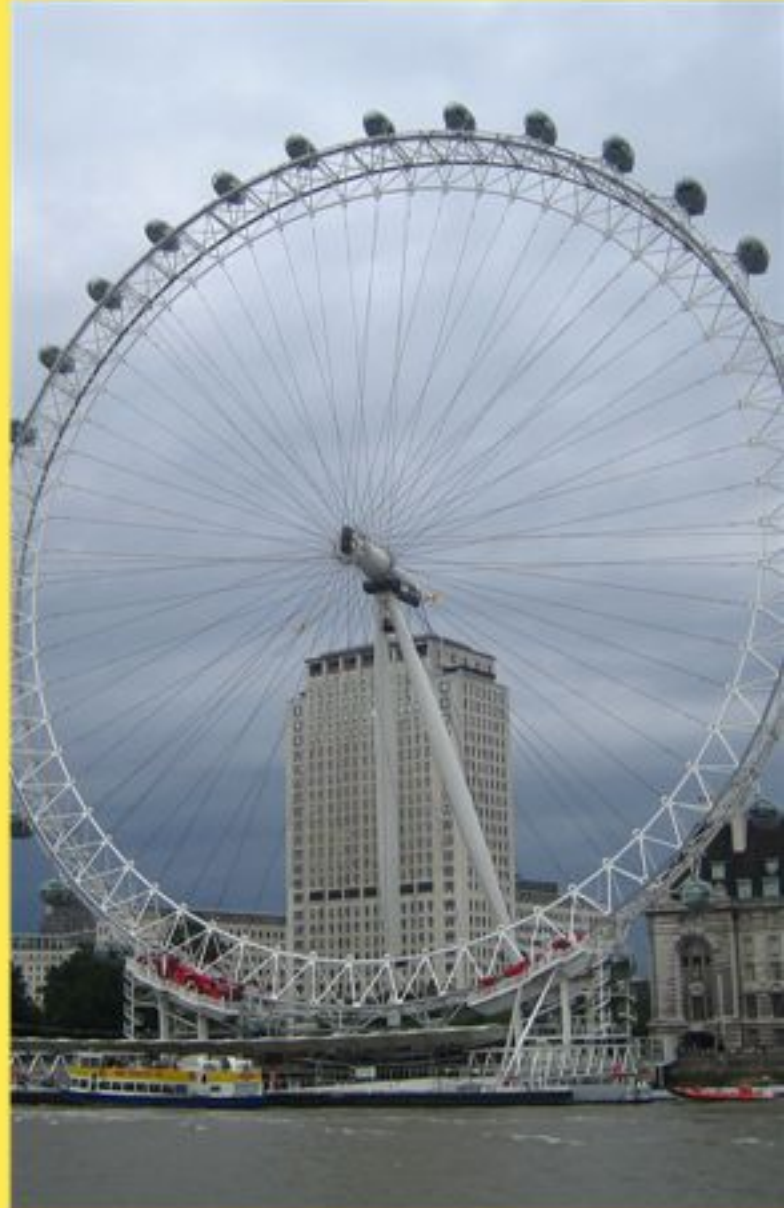
London Eye - great views guaranteed