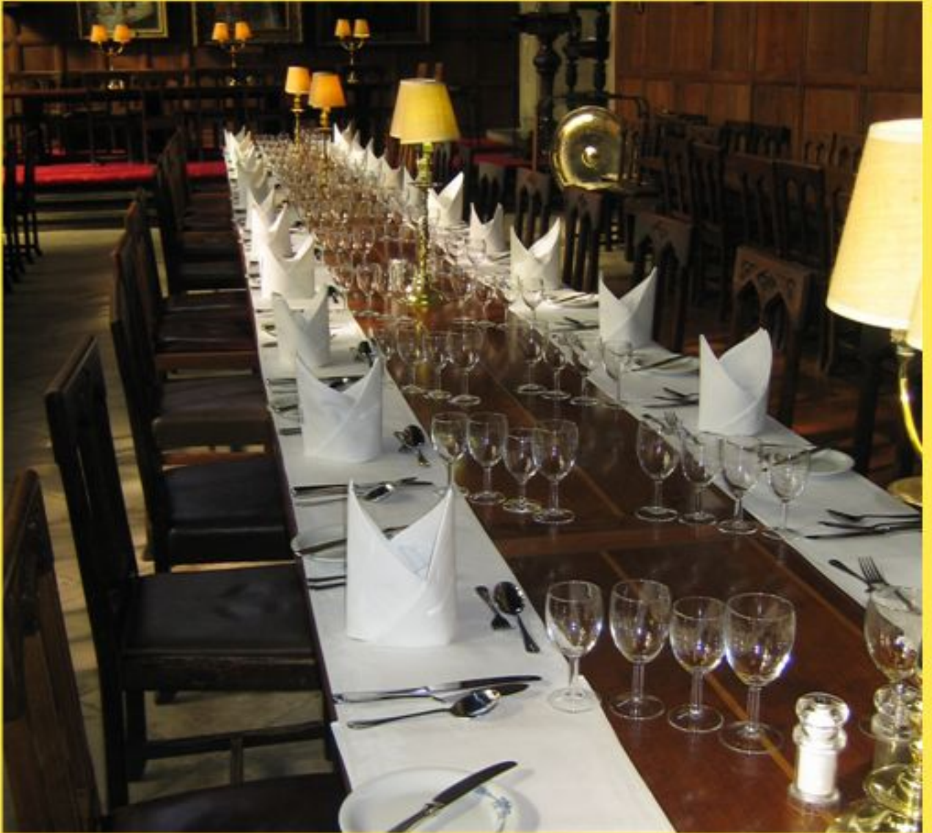
Dining Hall - es ist serviert