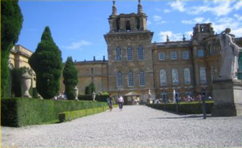
Ein Einfamilienhaus der Extraklasse