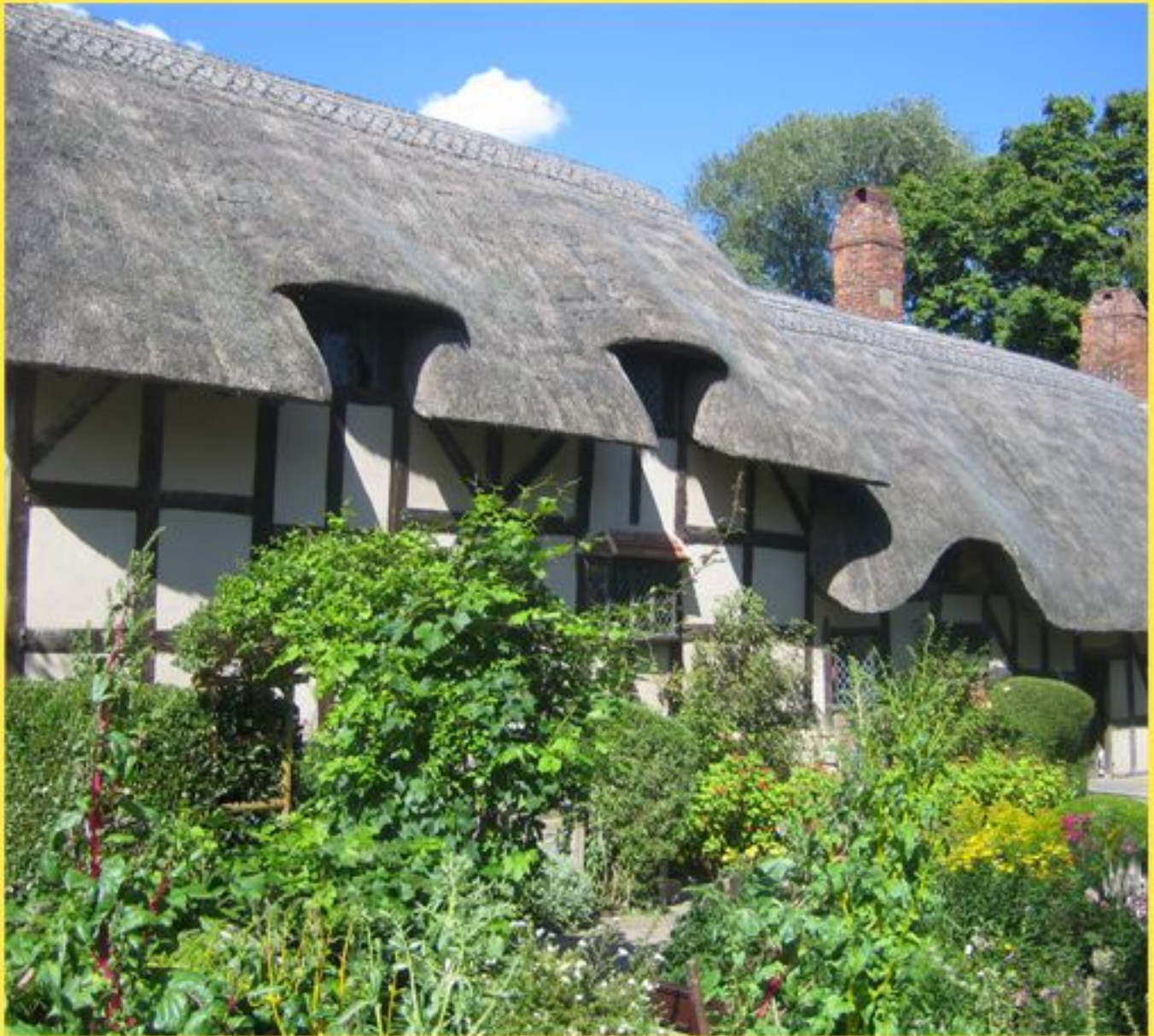
Ann Hathaway's Cottage, das Geburtshaus von Mrs. Shakespeare