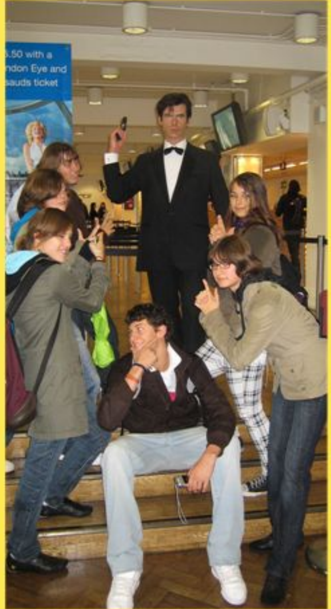
Cool, James Bond ist nicht weit!