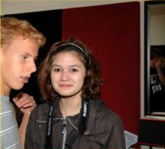
Besuch im Malmaison, dem ehemaligen Gefängnis