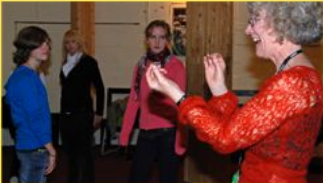
Theaterworkshop im Globe