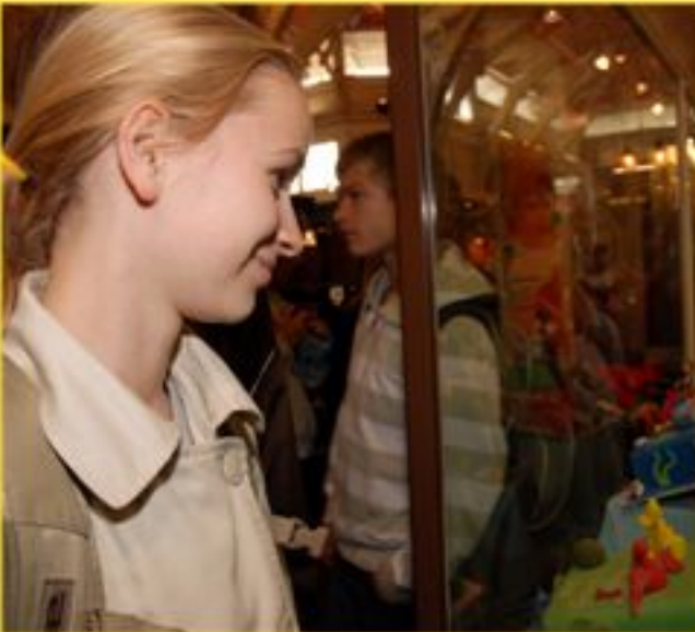
im Covered Market von Oxford